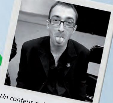
Un conteur qui aborde tous les grands sujets de la vie...