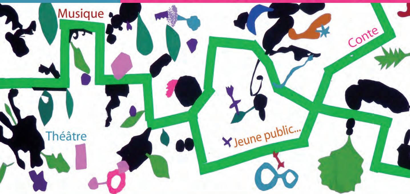
Visuel extrait du livre accordéon réalisé par les enfants lors de l'atelier animé par Claire Dé à Polminhac la saison dernière

Découverte - Rencontre - Rire - Emotions