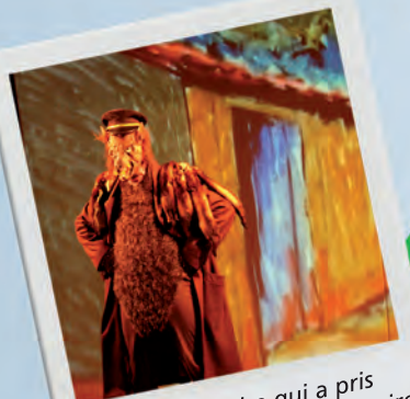
Une histoire qui a pris les couleurs de notre histoire

Durée : 1 h SÉANCES SCOLAIRES A voir en famille Gratuit