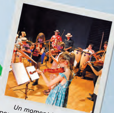
Un moment important pour les élèves et leurs familles

Venez découvrir, écoutez et voir, le temps d'un gala, les élèves de l'école de musique et de danse.