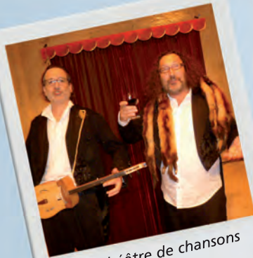
Un théâtre de chansons et de blagues...