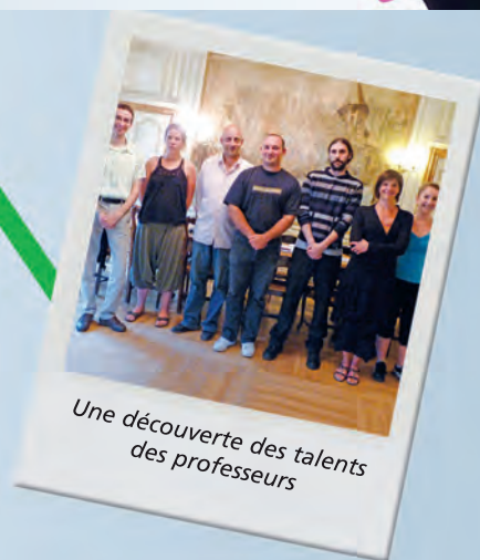
Une découverte des talents des professeurs

Venez découvrir et écoutez, le temps d'un concert les professeurs de l'école de musique.