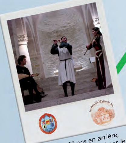
Retour 800 ans en arrière, où l'amour était chanté par les troubadours