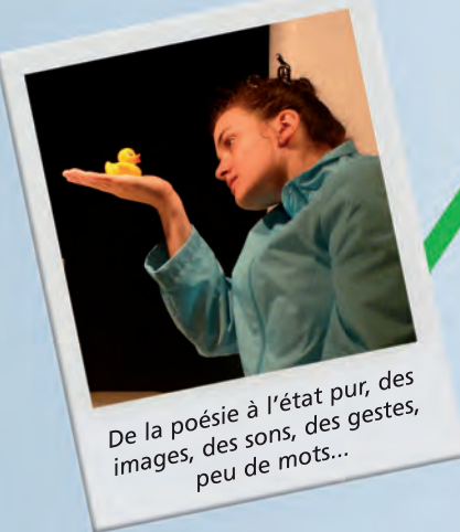
De la poésie à l'état pur, des images, des sons, des gestes, peu de mots...

Durée : 25 min SÉANCES SCOLAIRES et Relais d'assistantes maternelles