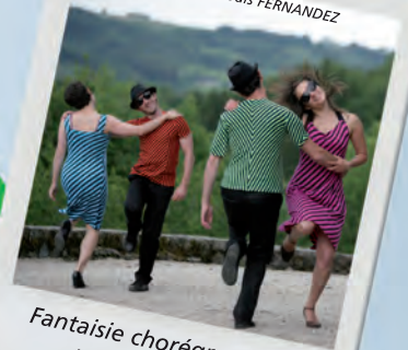
Fantaisie chorégraphique pour 4 danseurs Création In-situ